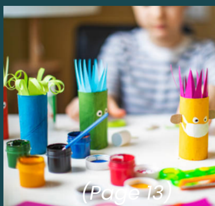
(Page 13) LOISIRS CRÉATIFS (Page 13)