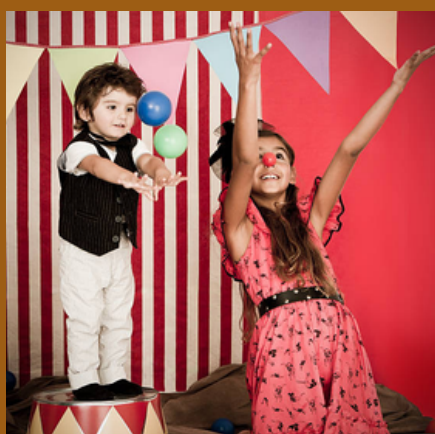
CIRQUE (Page 11)