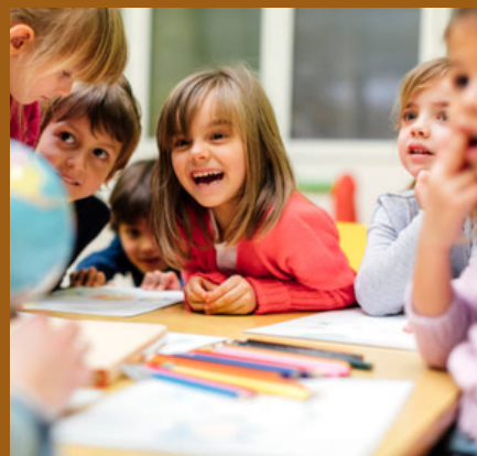
EXPLORATEURS (Page 20)