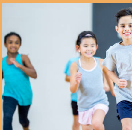
MULTI-SPORT (Page 17)