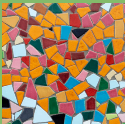
MOSAÏQUE (Page 16)