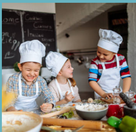
CUISINE (Page 10)