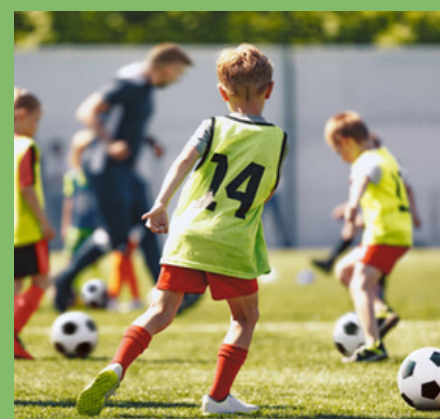
FOOT (Page 15)