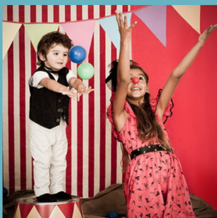
CIRQUE (Page 11)