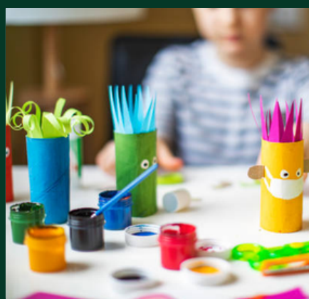
LOISIRS CRÉATIFS (Page 13)