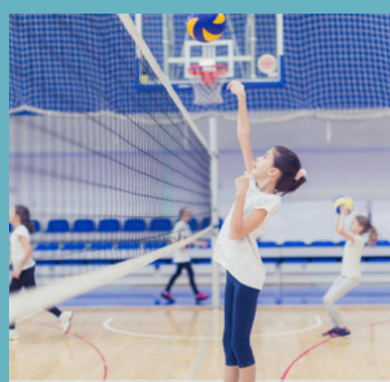
VOLLEY-BALL (Page 14)