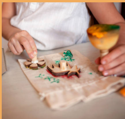
ATELIERS TEXTILES (Page 19)