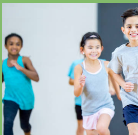
MULTI-SPORT (Page 17)