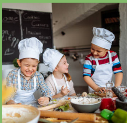
CUISINE (Page 10)