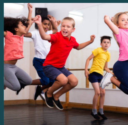
EVEIL CORPOREL (Page 12)