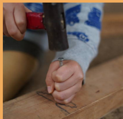
TRAVAIL DU BOIS (Page 18)